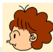
④唇をしっかり閉じ、上下交互に唇をふくらます