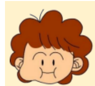
③左右交互にふくらます