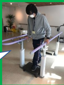
平行棒を使って歩行練習中